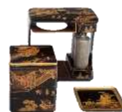
「参詣蒔絵提重」 (お辨當箱博物館蔵)

* 会期中一部展示替えがあります…前期:3月14日(火)～4月9日(日) 後期:4月11日(火)～5月7日(日)