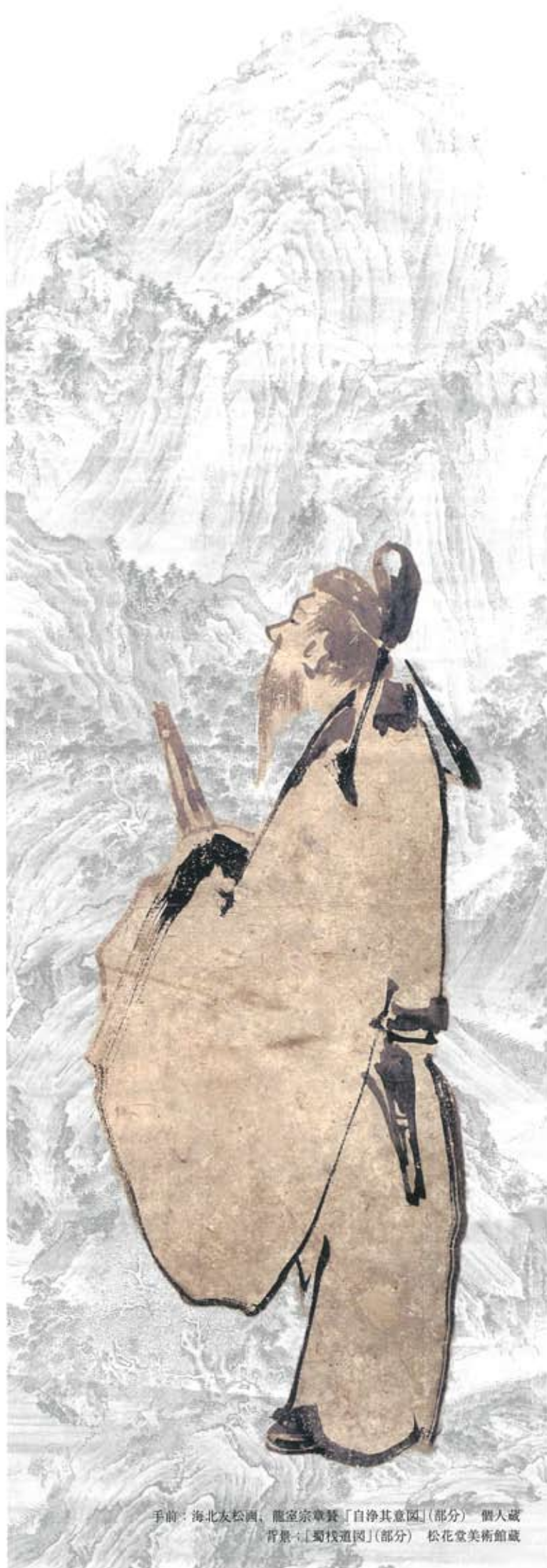
手前: 海北友松画、龍堂宗尊賛「自浄其意園」(部分) 個人蔵 背景: 「蜀棧道園」(部分) 松花堂美術館蔵