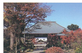
8 神應寺【重文】 貞観元年(860)に石清水八幡宮を開いた行教が創建。重文の行教律師座像や、豊臣秀吉の衣冠束帯の像を安置。