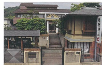
1 飛行神社 日本で初めてゴム動力のプロペラ式飛行機を発明した二宮忠八氏創建の神社。忠八ゆかりの資料などを鑑賞できる資料館も。