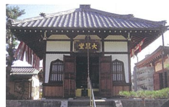
3 単伝庵(らくがき寺) 大黒様に願いごとが見えやすいように、壁に願いを書き入れる「落書き祈願」ができるユニークな寺。