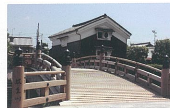
2 安居橋 男山の麓を流れる放生川に架かる橋で、八幡八景の一つ。別名「たいこ橋」。