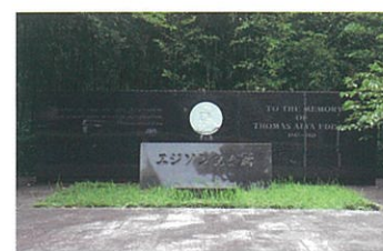
7 エジソン記念碑 トーマス・エジソンが八幡産の真竹を使って白熱電球の1000時間点灯に成功し、実用化に至った。石碑は戦前の1934年から守り継がれ、エジソンの偉業を称えている。