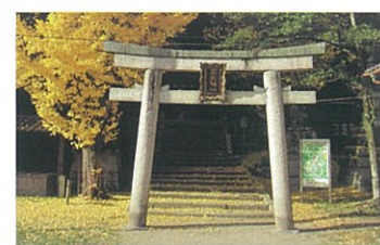
9 高良神社 石清水八幡宮の麓、頓宮の南に鎮座する八幡の氏神さん。兼好法師が著した徒然草第52段の逸話が有名。