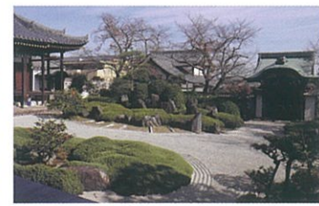
5 正法寺【重文】 室町時代は後奈良天皇の勅願寺。後に徳川家康公の側室、お亀の方(相応院)の菩提寺として発展。重要文化財を多数所蔵するほか、庭園は府の名勝に指定。