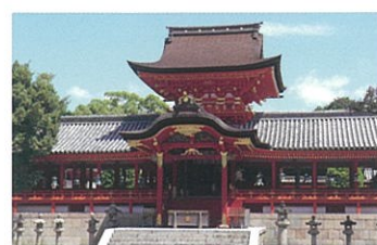
6 石清水八幡宮【国宝】 日本三大八幡宮のひとつ。現社殿(国宝)は三代将軍・徳川家光の造営。