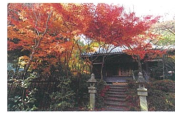
4 善法律寺 石清水八幡宮の検校職であった善法律寺宮清が自分の邸宅を僧坊として寄進し、奈良東大寺より実相上人を招いて開山。別名「もみじ寺」。