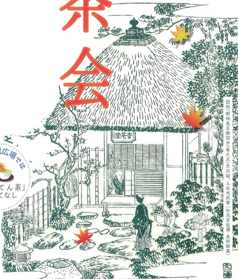
図版「都林泉名勝園会(巻之五)月次絵、土佐光武筆(松花堂庭園・美術館蔵)