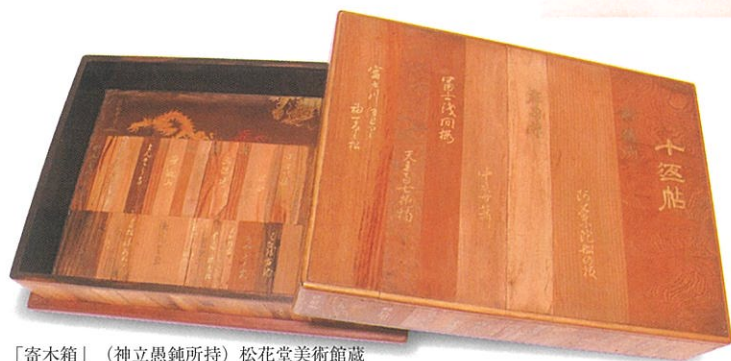
「寄木箱」(神立愚鈍所持)松花堂美術館蔵