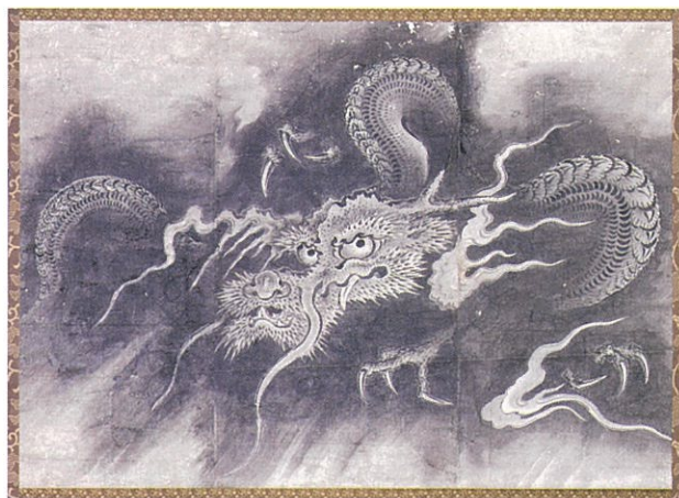
「雲龍園」松花堂美術館蔵