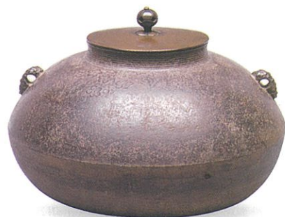
大西浄清「松梅地紋達磨釜」松花堂美術館蔵

〒614-8077 京都府八幡市八幡女郎花43-1 お問い合わせ先 TEL.075-981-0010 / FAX.075-981-0009 http://www.yawata-bunka.jp