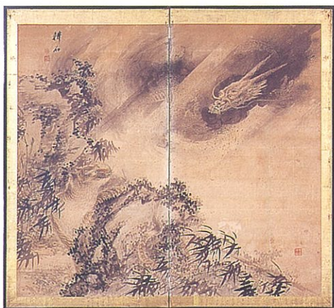
中西耕石「龍虎図」個人蔵