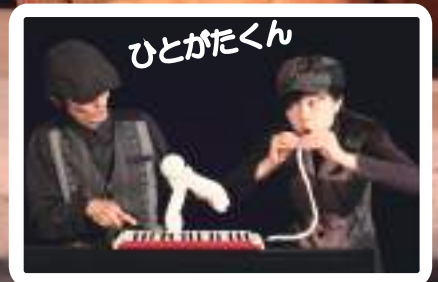
「人」の形をしたひとがたくんがコミカルに大暴れ！！